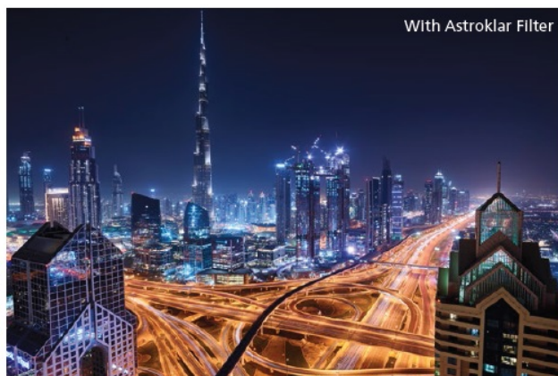
With Astroklar Filter

Fotografování noční oblohy s téměř neviditelnými hvězdami, částečně osvětlené objekty, hra se stíny, a dokonce i