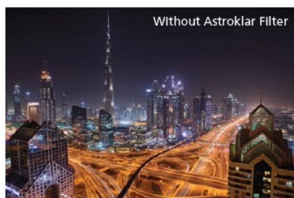
Without Astroklar Filter